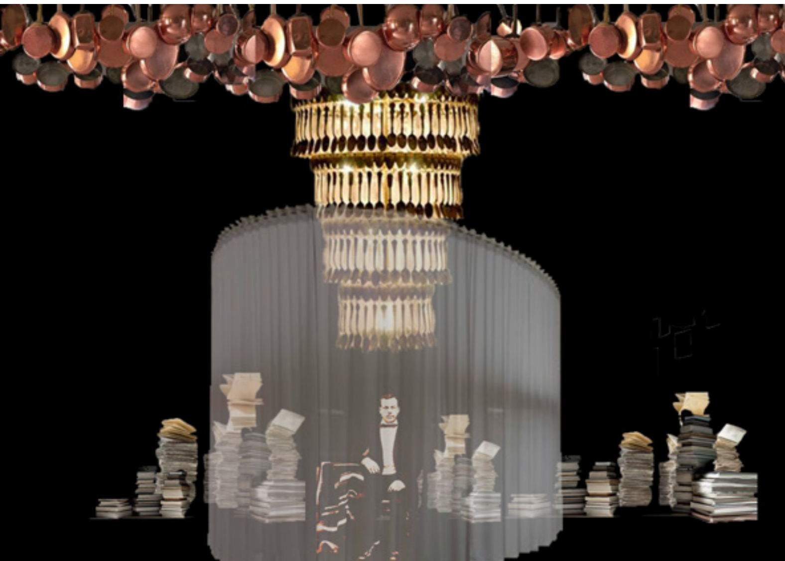
Photomontage - Acte II, chez Ragueneau

Adèle Collé, Scénographe de Cyrano de Bergerac